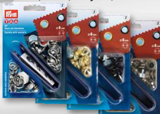
D - nikel, mosaz, černý nikel, staromosaz