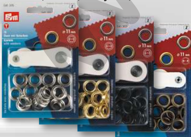
E - nikel, mosaz, černý nikel, staromosaz