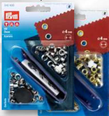
A - nikel, mosaz